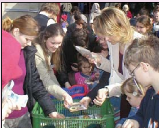
V nedeľu po detskej sv. omši sa veriaci z farnosti Trnávka v Bratislave zapojili do podujatia formou predaja doma napečených koláčikov.

Tokoročný výťažok podujatia použijeme ako vždy na rozšírenie kapacít a opravu zariadení: Azylový dom Emauzy – útulok Holíč a Azylové centrum Betánia – útulok Malacky, ktoré prevádzkuje nezisková organizácia Križovatky v Skalici.