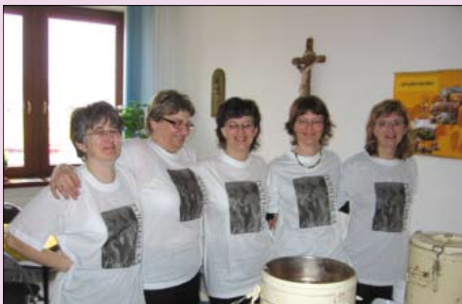
Členky združenia Centrum pre rodinu pri rozdávaní pôstnej polievky na Klokočine v Nitre v tričku s logom Podel'me sa!

V zariadeniach, ktoré ste podporili v dvoch podujatiach Podel'me sa! (v roku 2007 a v roku 2008), sa narodilo už 11 detí.