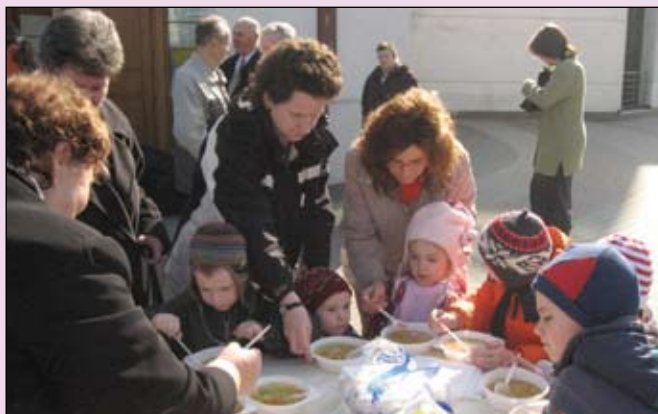
V Bratislave v Ružinove sa po sv. omši podujatia zúčastnili všetky vekové kategórie – aj tí najmenší.